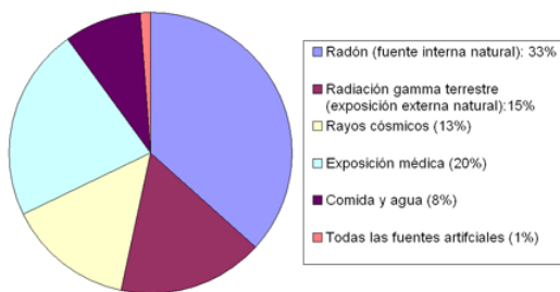
EXPOSICIÓN A LAS RADIACIONES IONIZANTES EN HUMANOS

Las distintas radiaciones se diferencian por la cantidad de energía que pueden transportar, y por tanto, los posibles efectos biológicos que éstas puedan ocasionar dependerá de la cantidad de energía que lleve la radiación y la capacidad de absorción por parte del cuerpo del trabajador/a.